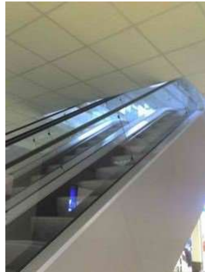
Problème de vision dans l'espace et de coordination