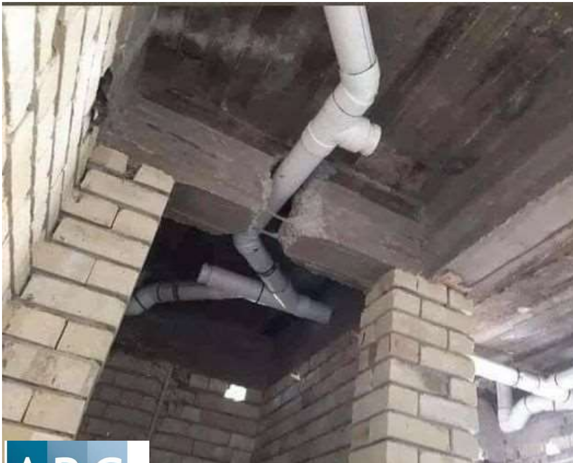
Problème de structure