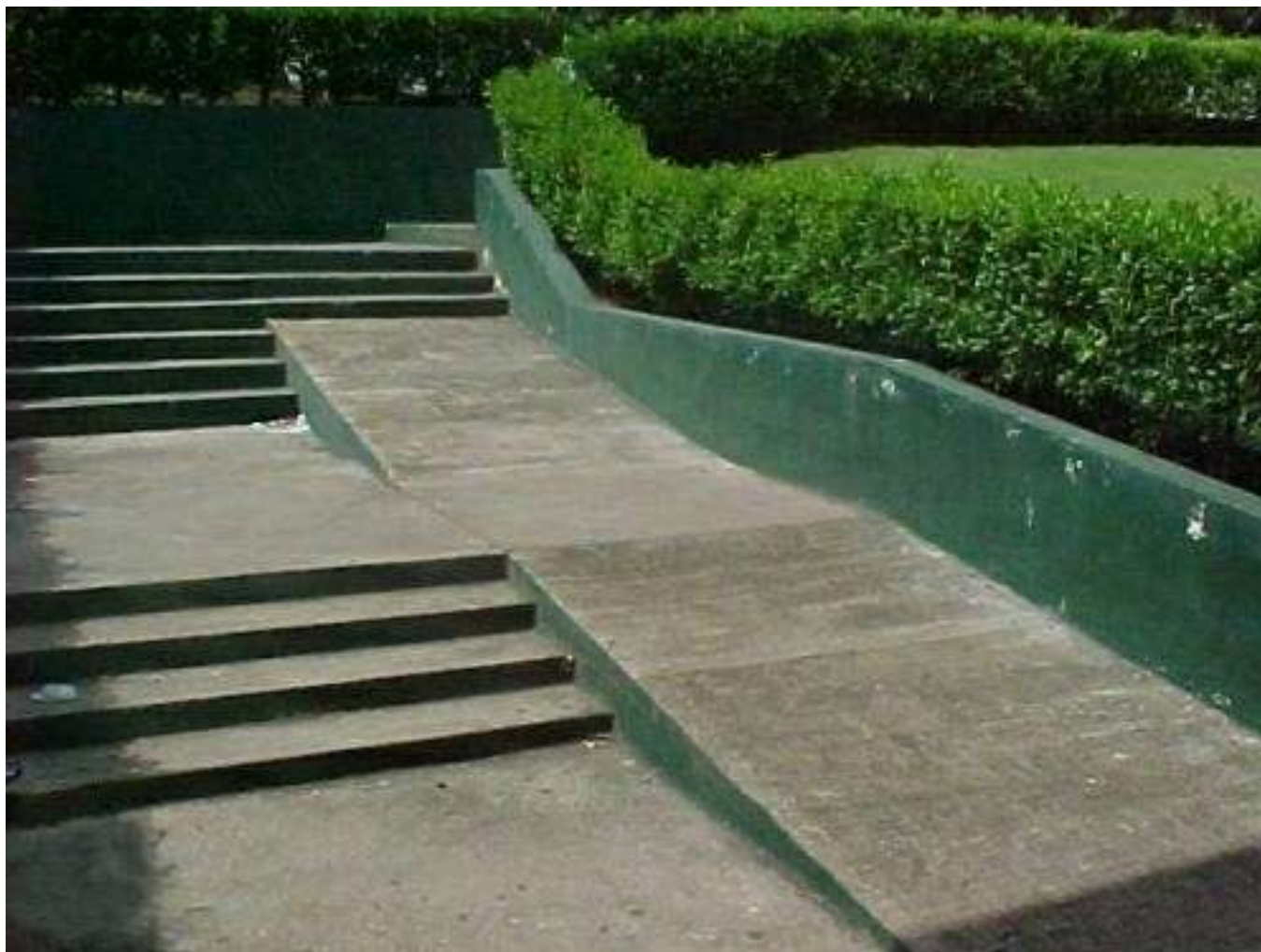
Problème de réglementation PMR