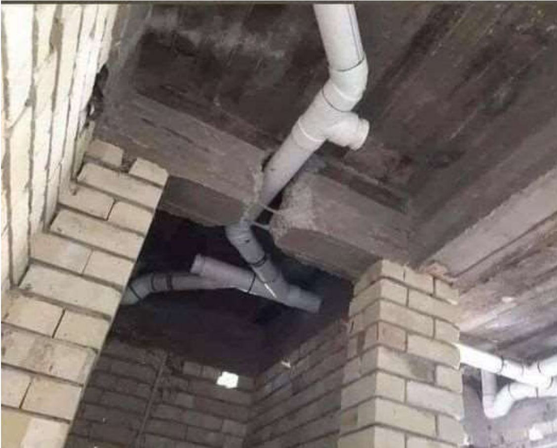
Problème de structure